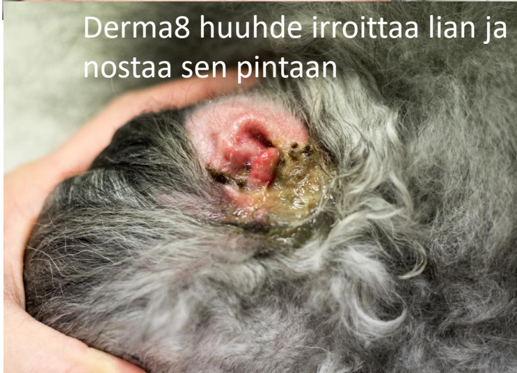
Derma8 huuhte irroittaa lian ja nostaa sen pintaan

Derma8 Ear cleaner on tehokas korvanpuhdistusvalmiste.