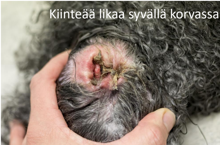
Kiinteää likaa syvällä korvassa